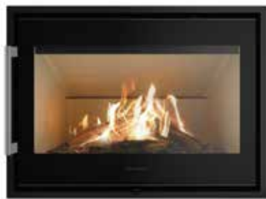
I40/55m Modern Door