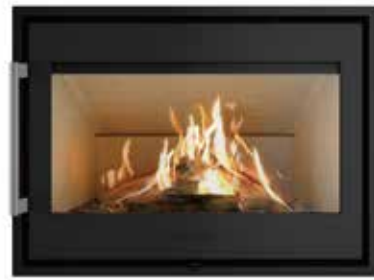
I40/55c Classic Door