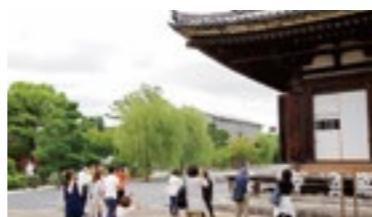
第一回Webびお養成塾でのフィールドワーク風景(京都)